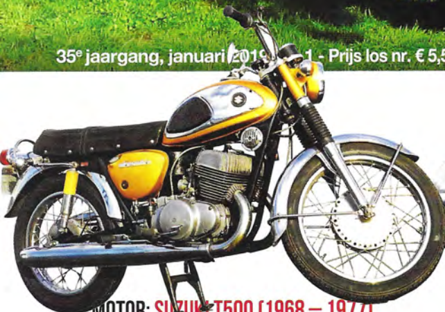
MOTOR: SUZUKI T500 (1968 - 1977)

35° jaargang, januari 2019 - Prijs los nr. € 5,50 - bij abo slechts € 3,30