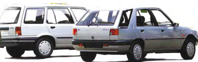
UNIEK: PEUGEOT 205 NEPALA EN 309 BREAK